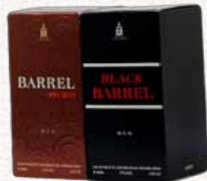
عطر (أوم) للجسم UM Black Barrel EDT