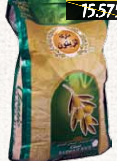
أرز بسمتي (زيتون) Olive Basmati Rice