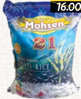
أرز بسمتي (محسن 21) Mohsen 21 Basmati Rice