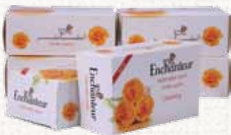
صابون (إنتشانتر) Enchanteur Soap