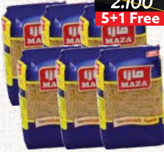
شعيرية (مازا) Maza Vermicelli