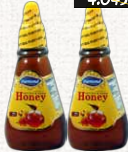
عسل (دايموند) عصارة Diamond Honey Squeeze