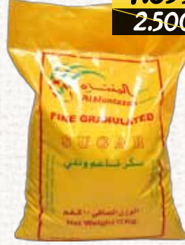
سكر (المنتزه) Almontazah Sugar Bag