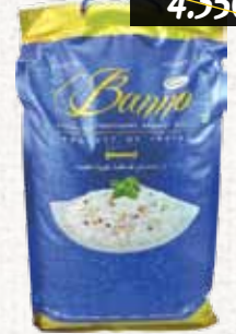
أرز بسمتي (بانو) Banno Basmati Rice