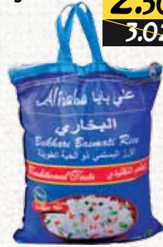
أرز بسمتي (علي بابا) Al Baba Basmati Rice