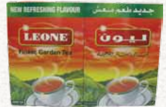
شاي بودرة (ليون) Leone Tea Packet