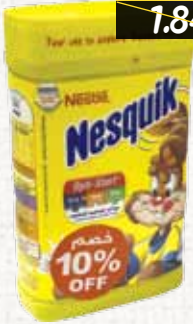
مسحوق حليب (نيسكويك) Nesquik Choco Drink