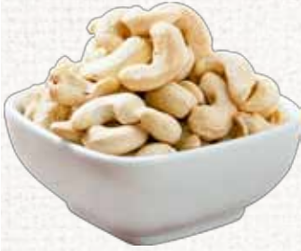
كاجو غير محمص Cashew Unroasted