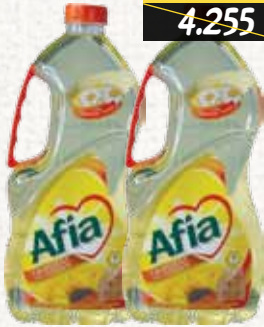
زيت دوار الشمس (عافية) Afia Sunflower Oil