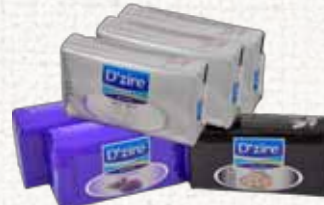
صابون (ديزر) D'zire Soap