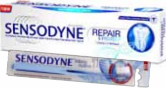
معجون الأسنان (سنسوداين) الحماية/المعالجة Sensodyne Toothpaste Repair/Protect