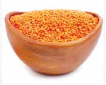
عدس أحمر Masoor Dal