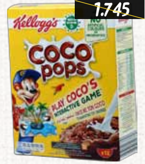
كورن فليكس (كلوقز) كوكو Kellogg's Coco Pops/ Jumbo