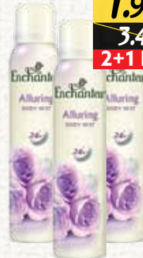
معطر الجسم (إنتشانتر) Enchanteur Body Mist