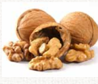
جوز عين الجمل Walnut Kernel