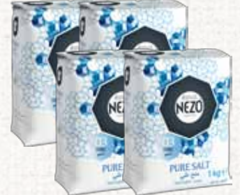
ملح (نيزو) Nezo Salt