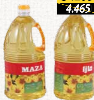
زيت الكانولا (مازا) Maza Canola Oil