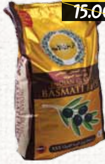
أرز بسمتي (الزيتون الأسود) Black Olives Basmati Rice