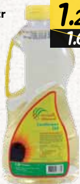
زيت دوار الشمس (المنتزه) Almontazah Sunflower Oil