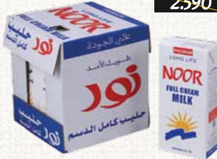
حليب (نور) طويل الأجل Noor UHT Whole Milk