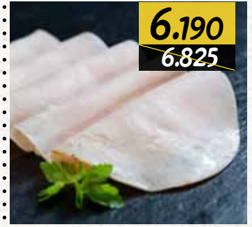
جبنة براميلي Bramali Cheese