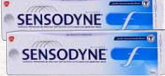
معجون الأسنان (سنسوداين) بالفلورايد Sensodyne Toothpaste Fluoride