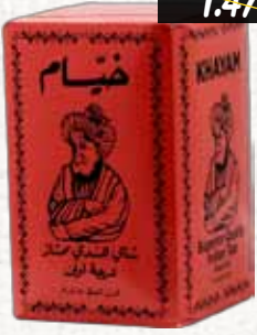
شاي (خيام) Khayam Tea