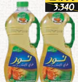
زيت القلي (نور) Noor Fry Lite Oil