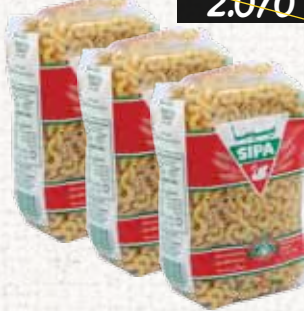
معكرونة (سيبا) Sipa Macaroni