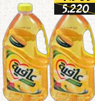
زيت الذرة (عافية) Afia Corn Oil