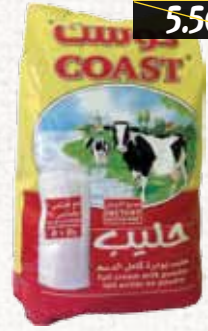
حليب بودرة (كوست) Coast Milk Powder Pouch