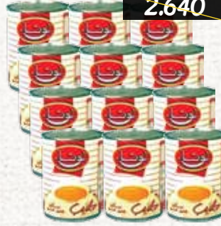
حليب (لونا) المبخر Luna Evaporated Milk