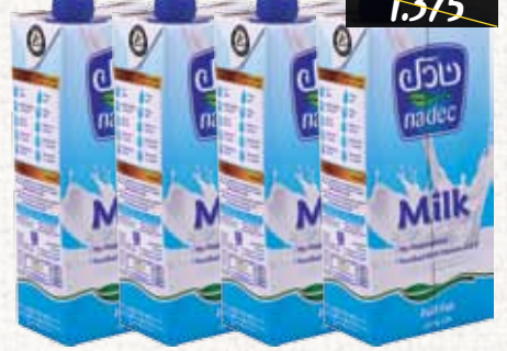
حليب (نادك) طويل الأجل Nadec UHT Whole Milk