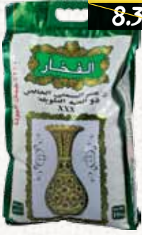
أرز بسمتي (فخار) Fakhar Basmati Rice