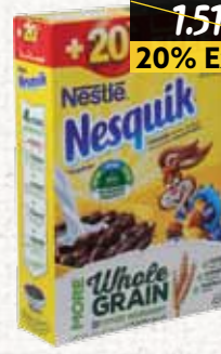
كورن فليكس (نيسكويك) رقائق Nesquik Choco Cereals