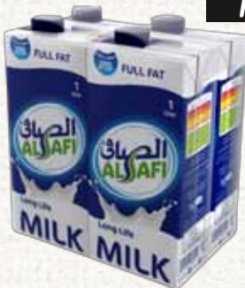
حليب (الصافي) Al Safi UHT Milk