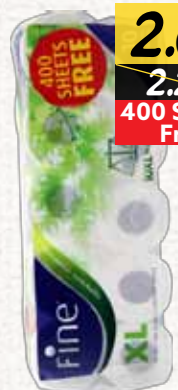
رول الحمام (فاين) Fine Toilet Roll