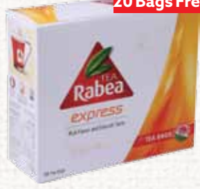
أكياس شاي (ربيع) Rabea Tea Bags