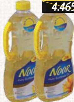
زيت دوار الشمس (نور) Noor Sunflower Oil